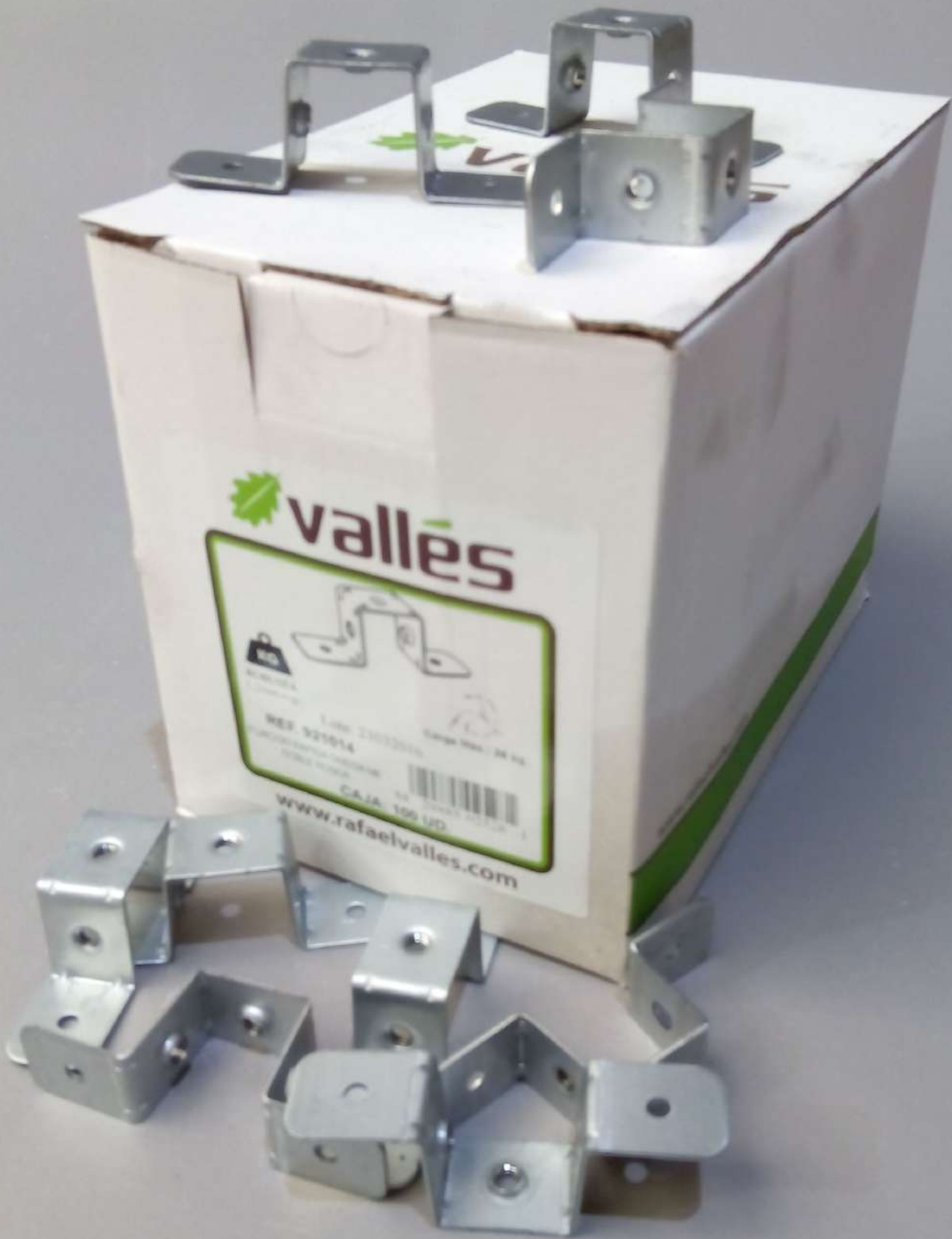
FIJACION OMEGA M6 DOBLE ROSCA Cajas de 100 uds