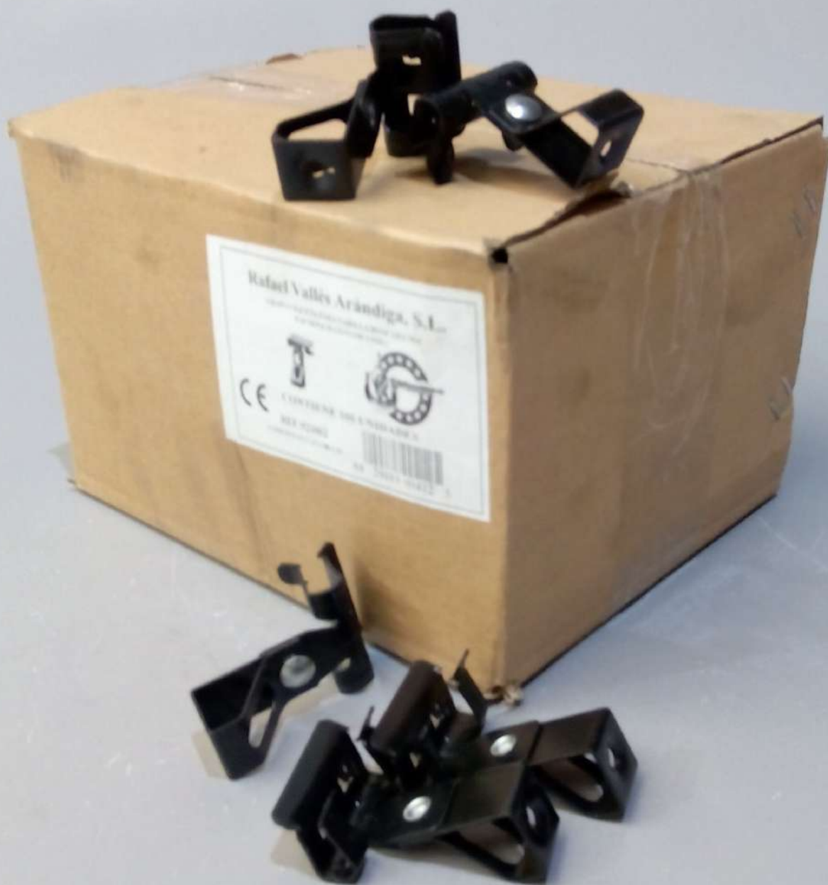
GRAPA VIGUETA 4-10MM M-6 - Cajas de 100 uds.