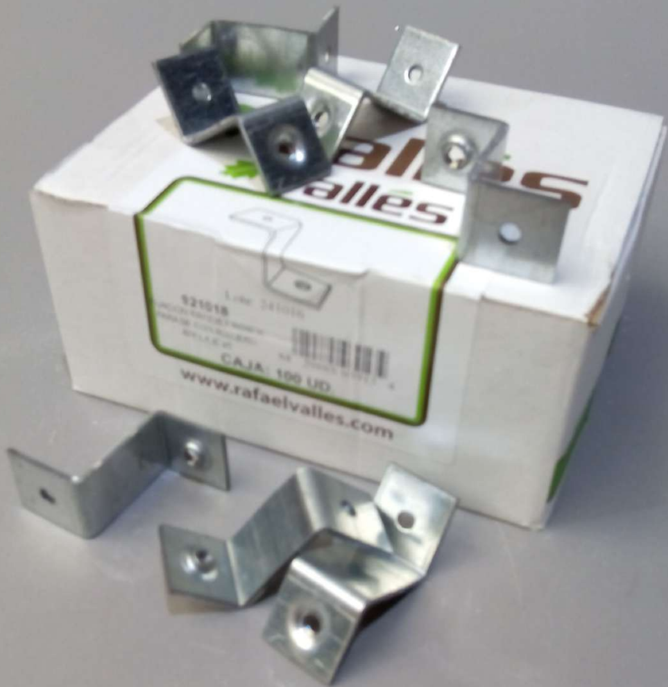
FIJACION "Z" ROSCA M6 - Cajas de 100 Uds.