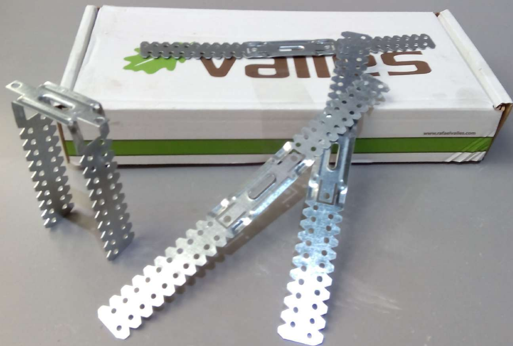
SUSPENS.ANCLAJE DIRECTO UNIVERSAL 51X120 . Cajas de 100 uds