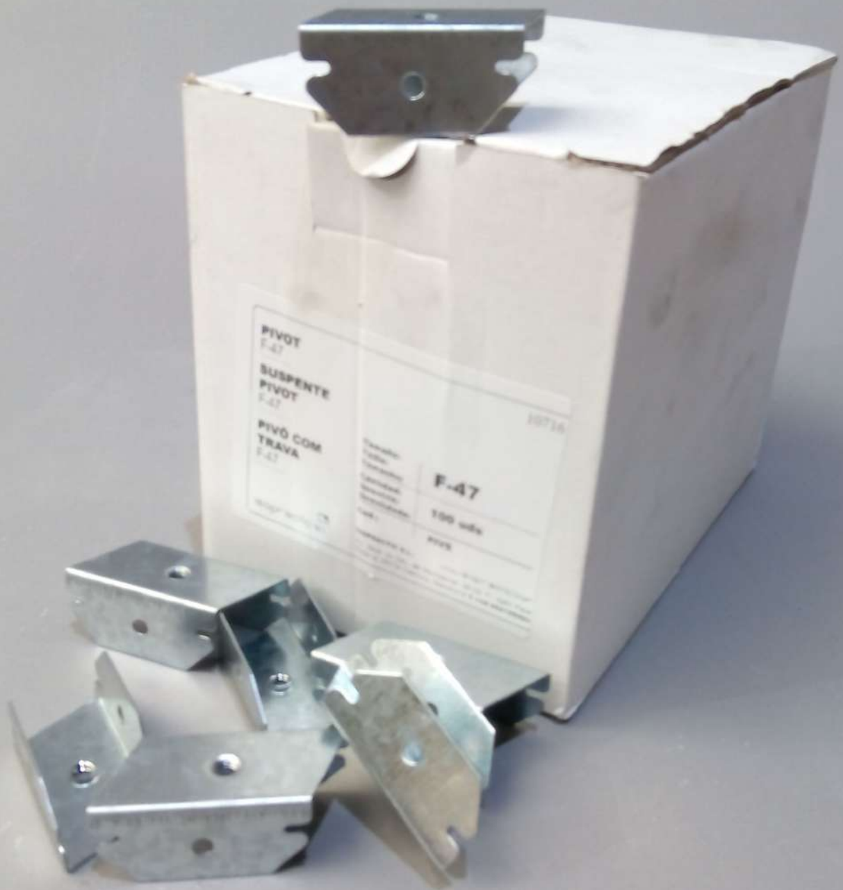
HORQUILLAS F45 -F-47 y F-60 Cajas de 100 uds