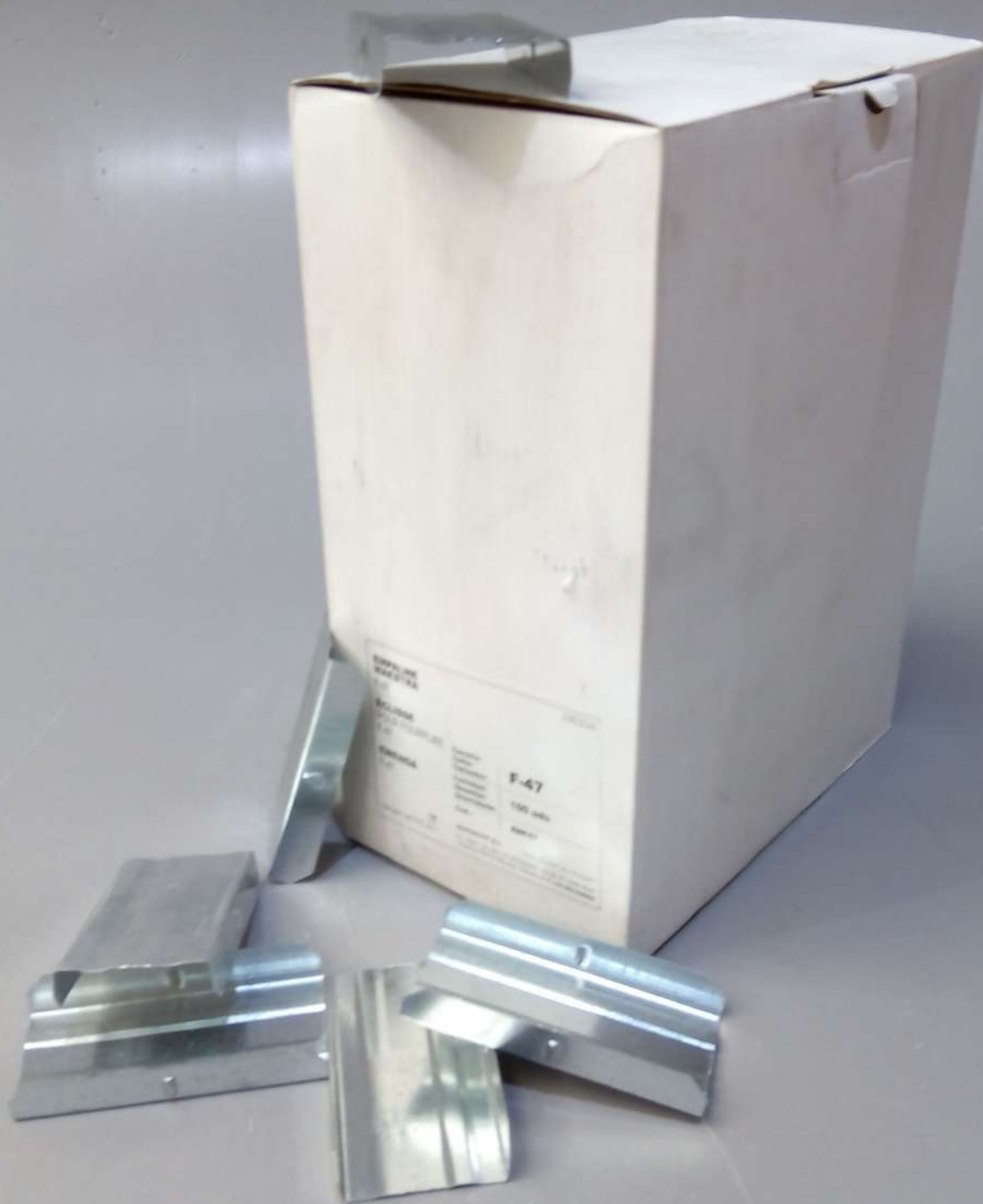
EMPALMES F-47 ; F-45 y F-60 Cajss de 100 uds.