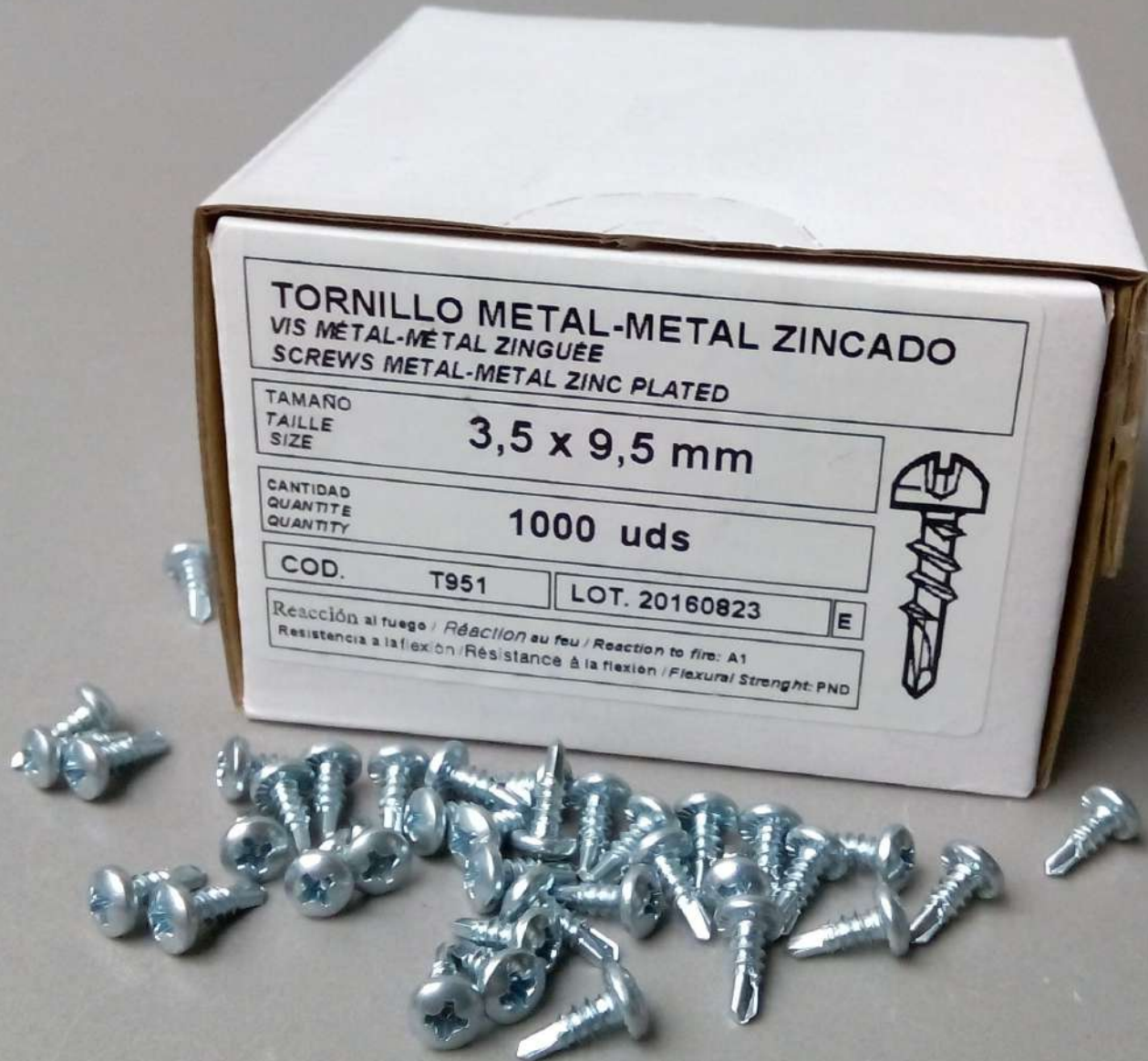
TORNILLOS TRPF METAL METAL ZINCADO 3,5X9,5; 3,5 X 13